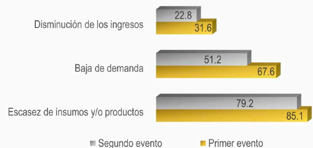
México. Tipo y Nivel de Afectación de las empresas por Covid-19 (porcentaje)